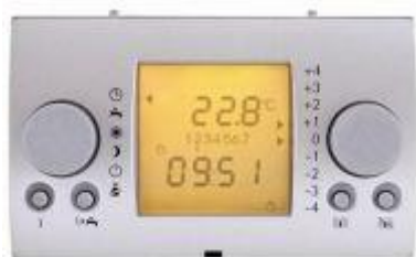
Модуль Wolf BM

В каскаде котлов контроллеры Wolf R1, R3 и R21 объединяет каскадный модуль Wolf KM с погодозависимым модулем Wolf BM. Каскад может состоять из 6 котлов.