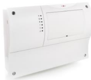
Модуль Wolf MM дополнительно управлять до 7

смесительными контурами в погодозависимом режиме.